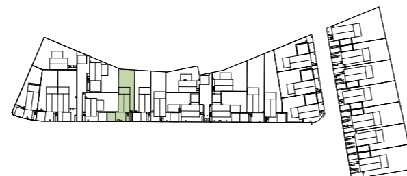
Situace 2. etapy / Situation of 2nd phase