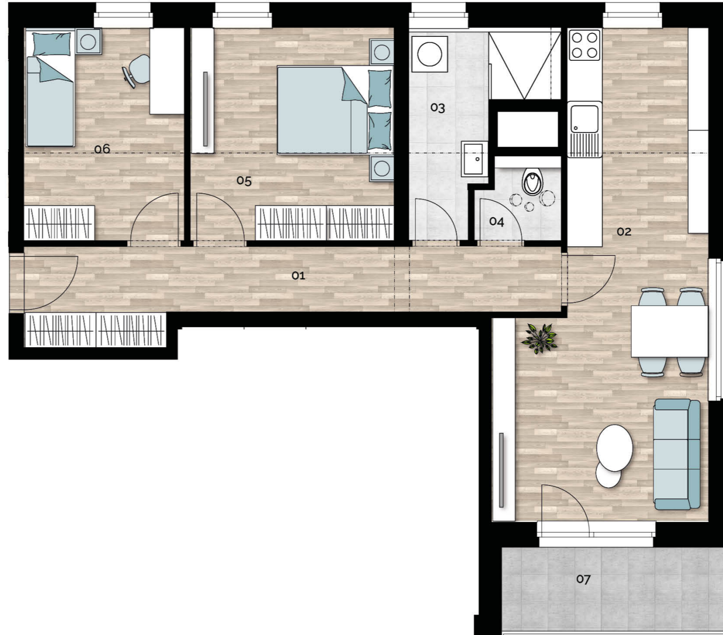
3.NP / 3th floor