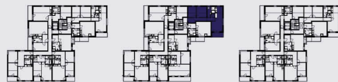
budova B / building B