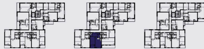
budova B / building B