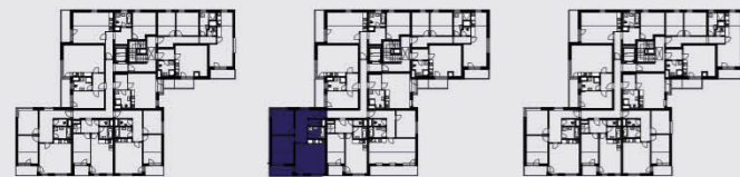
budova B / building B