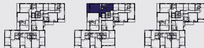
budova B / building B