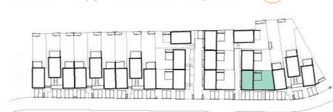
Situace 1. etapy / Situation of 1st phase