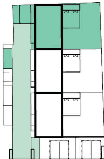
Schéma domu / House layout