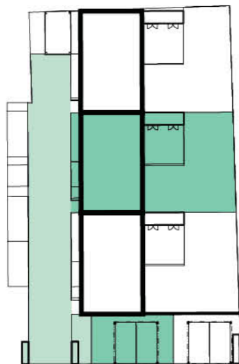
Schéma domu / House layout