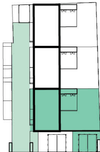
Schéma domu / House layout