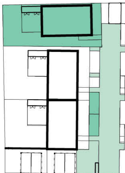
Schéma domu / House layout