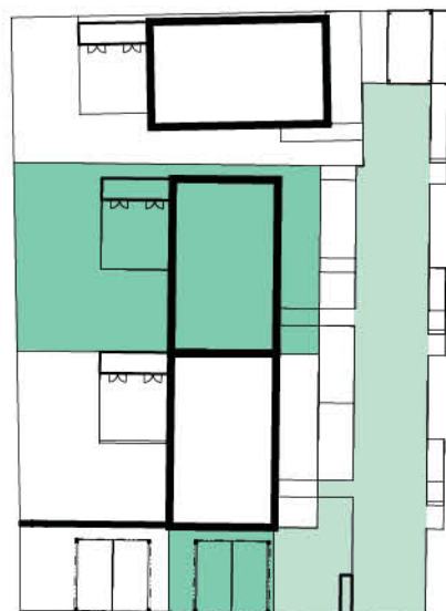
Schéma domu / House layout