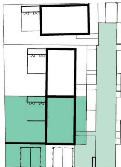
Schéma domu / House layout