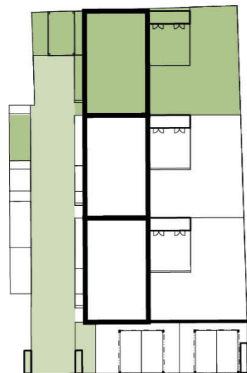
Schéma domu / House layout