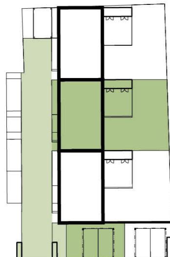
Schéma domu / House layout