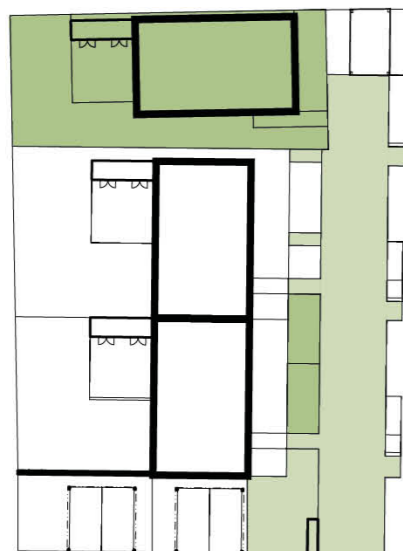
Schéma domu / House layout