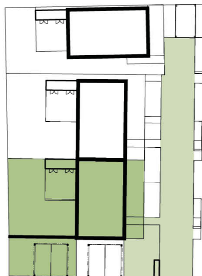
Schéma domu / House layout