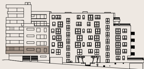
budova M1 - 1.NP / building M1 - 1st floor