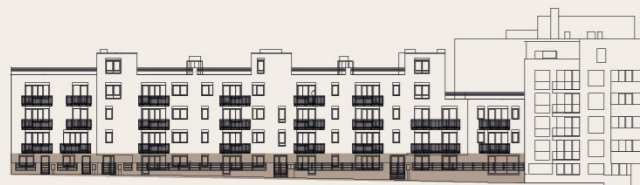
budova M2B - 1.NP / building M2B - groundfloor