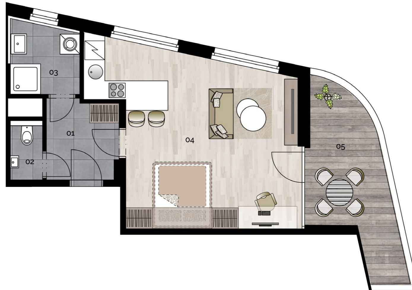
budova M1 - 1.NP / building M1 - 1st floor