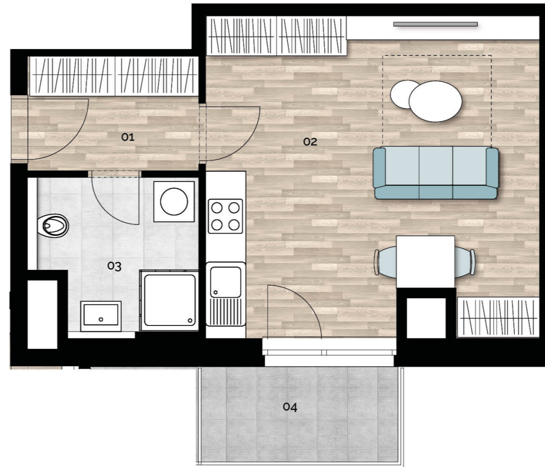
3.NP / 3th floor