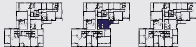
budova B / building B