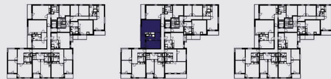
budova B / building B