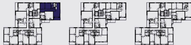
budova A / building A