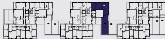
budova B / building B