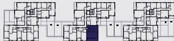
budova B / building B