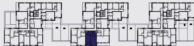
budova B / building B