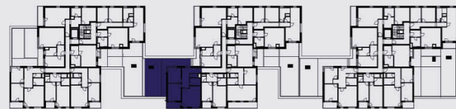
budova B / building B