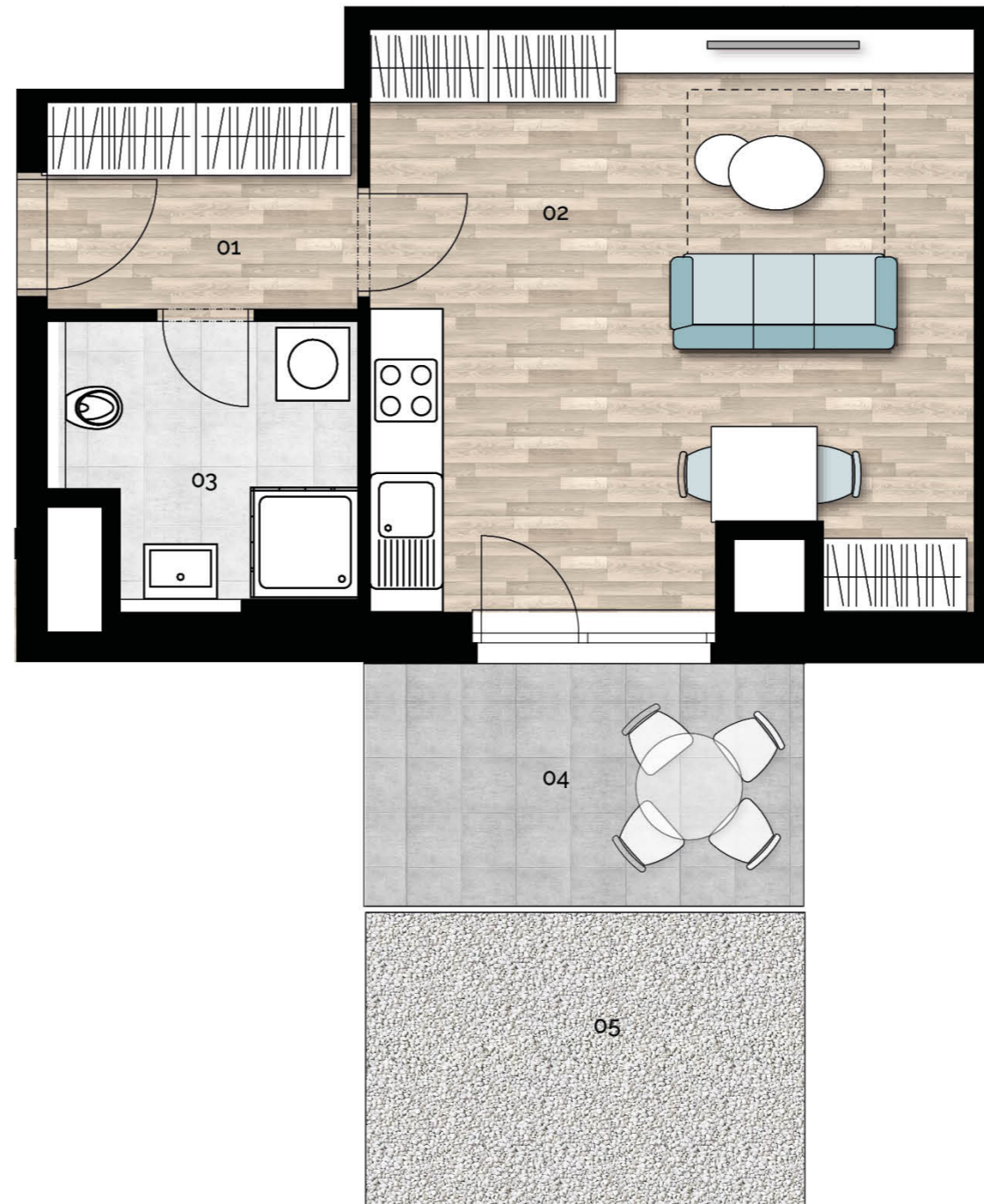
2.NP / 2nd floor