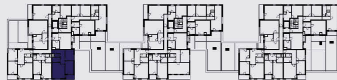
budova A / building A