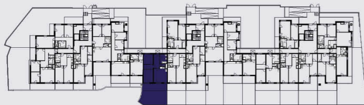
budova B / building B