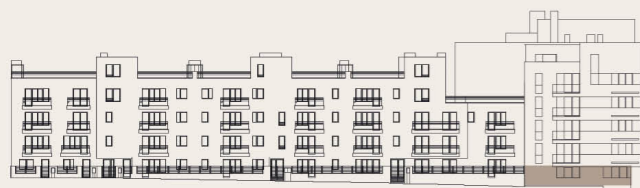
budova M1 - 1.NP / building M1 - 1st floor