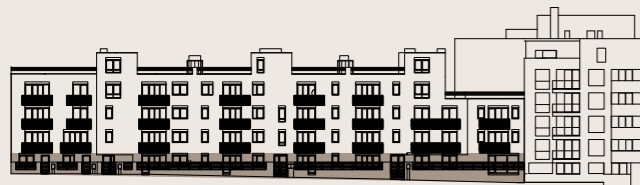
budova M2B - 1.NP / building M2B - groundfloor