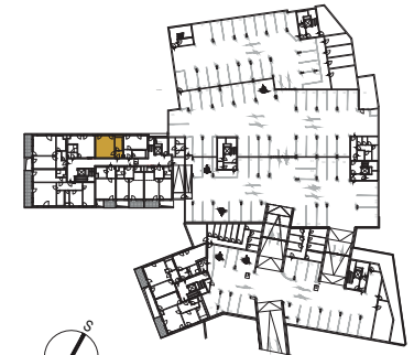
situační schéma 1PP