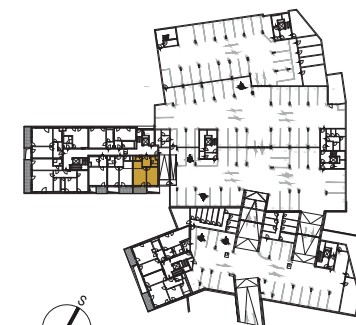
situační schéma 1PP