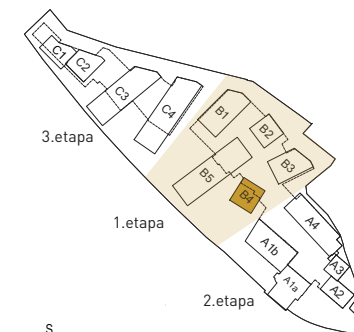
situační schéma projektu