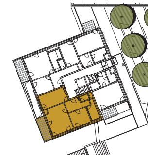
situační schéma 1NP